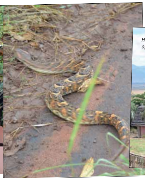
Het uitzicht over de vallei is schitterend met op de achtergrond de bergen van Soedan.