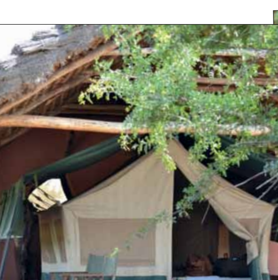
We zien een grote giftige pofadder. Jan en ik besluiten om de rits van onze tent die avond toch maar goed te sluiten.