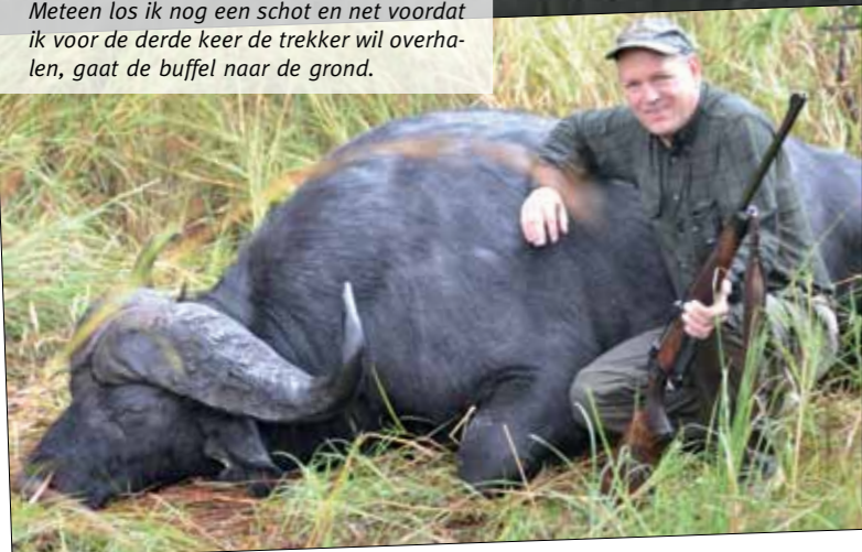
Meteen los ik nog een schot en net voordat ik voor de derde keer de trekker wil overhalen, gaat de buffel naar de grond.