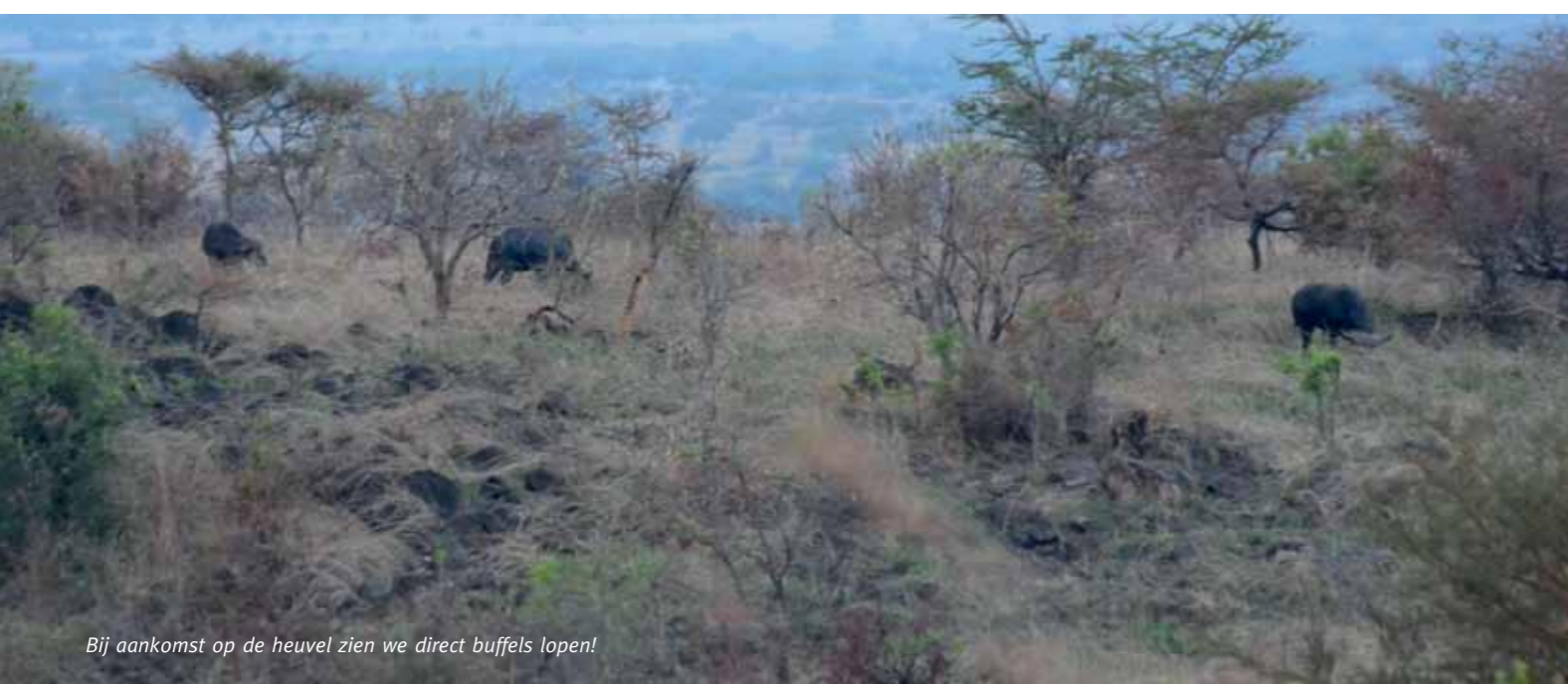
Bij aankomst op de heuvel zien we direct buffels lopen!

gebied lopen, maar helaas, vanavond niet. Wel zien we veel ander wild zoals zebra's, hartebeesten, waterbokken, wrattenzwijnen. Terwijl we teruglopen naar de jeep, zien we nog drie wrattenzwijnen door het gras lopen, heel kordaat met hun staartje omhoog. Woensdagochtend lopen we een lang spoor uit. We zijn dichtbij een mooie kans maar helaas staat de buffel niet goed vrij en hij ontdekt ons weer te snel waardoor hij in volle galop wegrent. Deze dag zien we weer veel wild gezien maar we hebben nog steeds geen kans op een buffel.