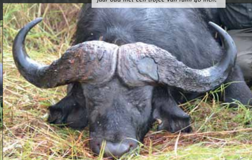
Het is een prachtige buffel van ongeveer 10 jaar oud met een trofee van ruim 40 inch.