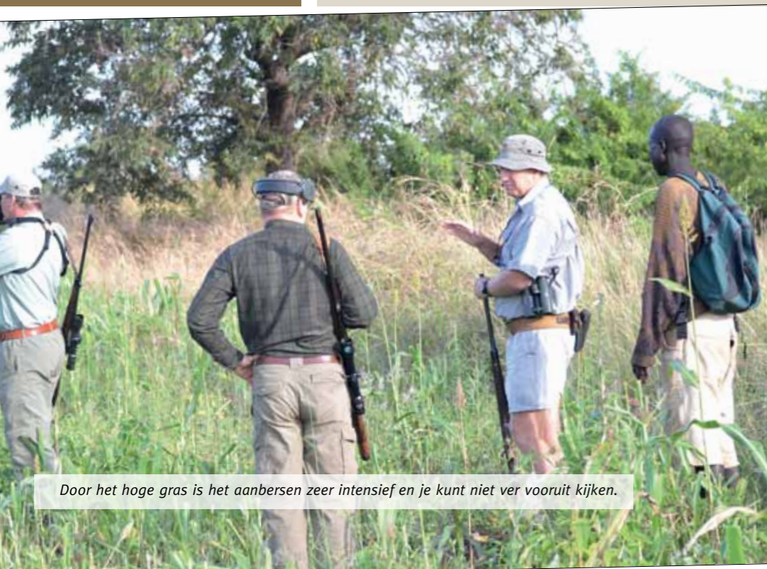
Door het hoge gras is het aanbersen zeer intensief en je kunt niet ver vooruit kijken.